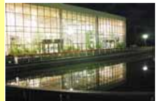
満月の夜の千秋が原アトリウム

山河花園 千秋が原は今年も鮮やかな紅葉でした。十一月十二日、満月に照らされたアトリウム。ホールの照明が池の水面に映され、て、昼とはまるで違った趣きでした。ヤシやガジュマルに包まれた館内に、ゴスペルの澄んだ歌声が響き渡り、一足早いクリスマスコンサートでは十一月下旬から一ヶ月間がクリスマスシーズンで、各地で宗教祭が催されます。姉妹都市トリアーの中心部でも多くの露天が広場を埋め尽くし、市民が溢れました。ローカルな品々に新鮮な興味を覚えたと共に、グリユウホツインと呼ばれるこの時期限定のホットワインの甘い味を思い出し、開催された全国豊かな海づくり大会のテーマは「守人」でした。環境改善へ向けた活動の数々。単独では解決されない山・川・海の繋がりの大切さが再認識された事に注目しています。被災地五ヶ所で「縄文ぶな街道ものがたり」がスタートしました。ブナ苗の育樹を通して被災地と、全国のオーナとの繋がりを作り、山の暮らしに元気を取り戻すと共に、自然界の循環を意識し、豊かな山の色と自然環境を復活、持続させる活動の「もの」がたりです。 今年も多彩なイベントが中越各地で展開され、熱い思いが伝わって来ました。