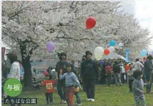
与板 たちばな公園