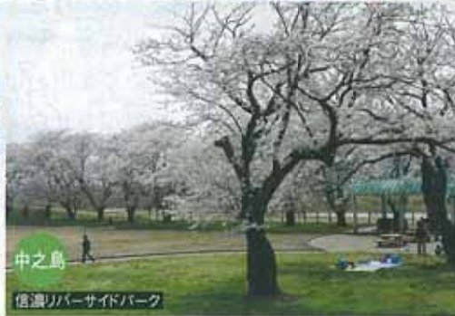
中之島 信濃リバーサイドパーク